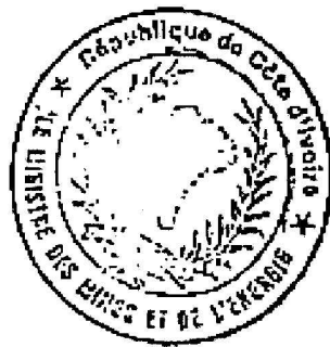
C. Amiral Mohammed Lamine FADIKA

P.J : Loi n° 94 500 du 6 Septembre 1994 Structure des prix des produits pétroliers.