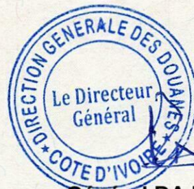
General DA Pierre A. Commandeur de l'Ordre National